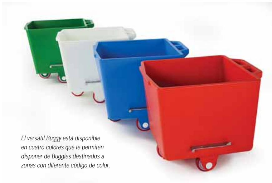
El versátil Buggy está disponible en cuatro colores que le permiten disponer de Buggies destinados a zonas con diferente código de color.

La triple pared de polietileno del carro Buggy para carne absorbe los ruidos mientras que los carros similares de acero inoxidable generan la habitual contaminación acústica. Los niveles de sonido durante el vaciado disminuyen en 17 decibelios. Incluso el ruido generado por los rodamientos se minimiza. Nuestro Buggy contribuye a la reducción del riesgo de dolencias auditivas.