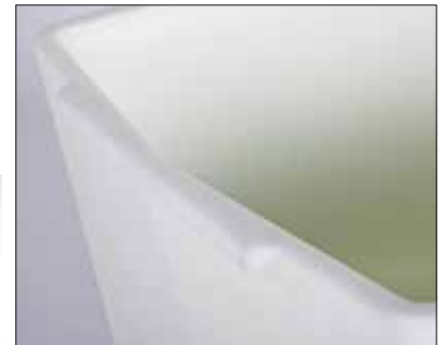
Asideros integrados para levantar fácilmente