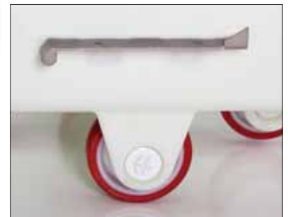
Abrazaderas integradas de acero inoxidable