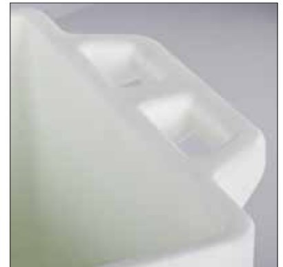
Asas ergonómicamente diseñadas